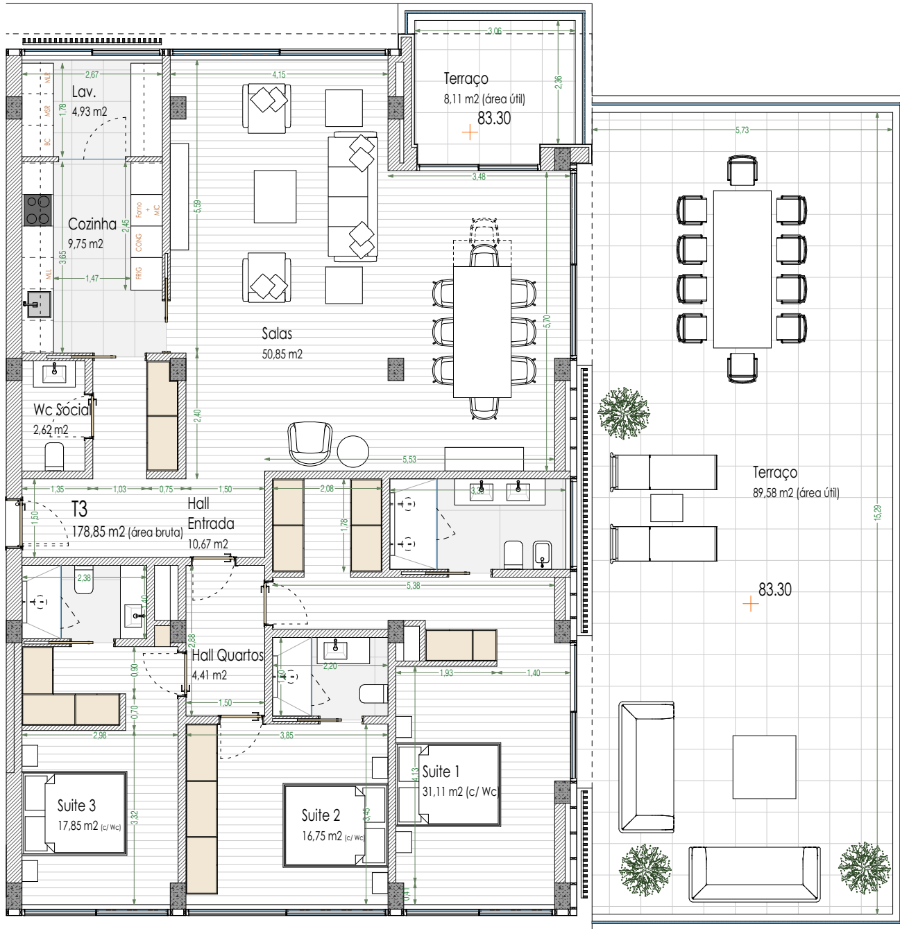
Planta Apartamento _esc: 1/100