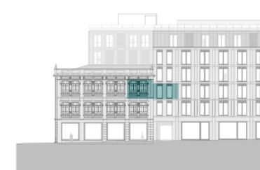
Alçado - Rua Formosa