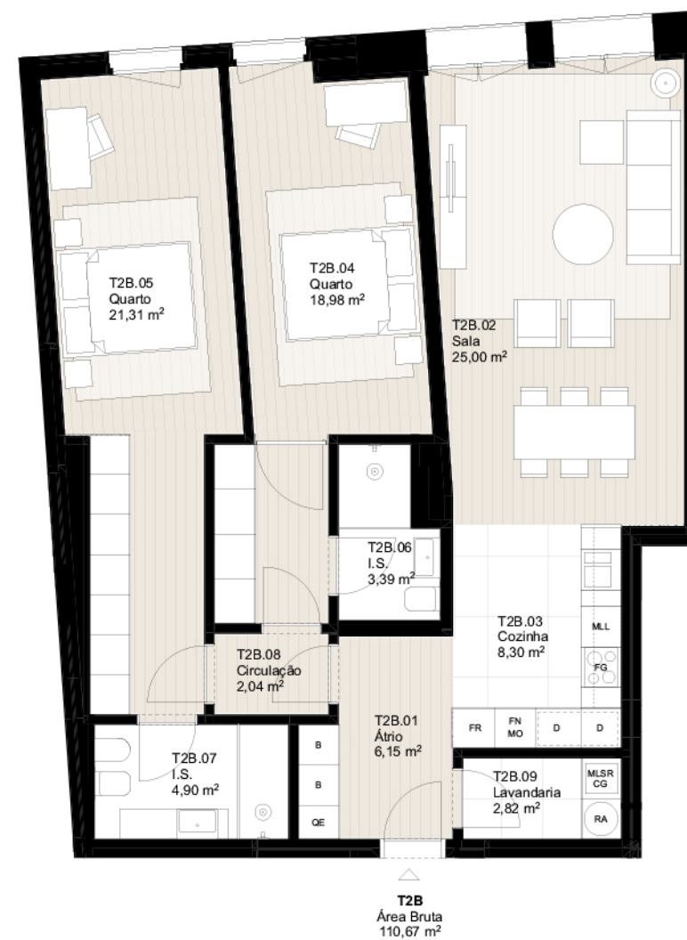
PLANTA DO PISO 2