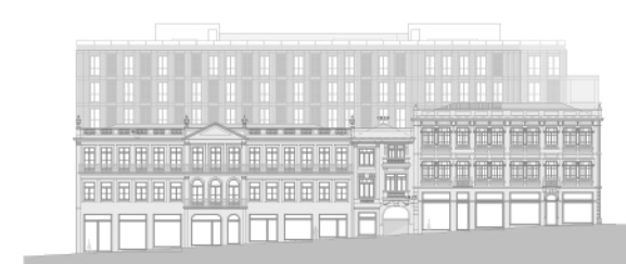
Alçado - Rua Sá da Bandeira