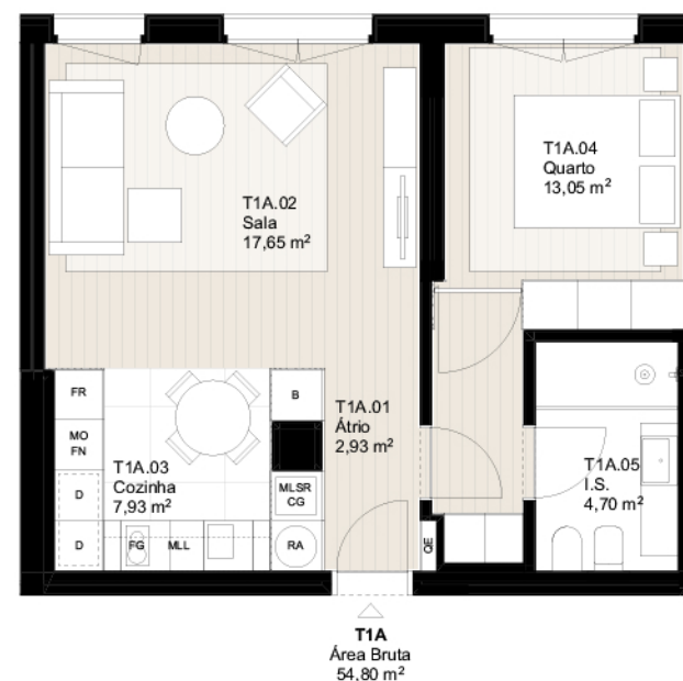
PLANTA DO PISO 4