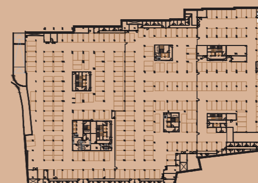
PLANTA PISO ESTACIONAMENTO -1 / PARKING FLOOR -1