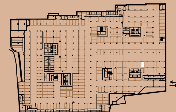
PLANTA PISO ESTACIONAMENTO -2 / PARKING FLOOR -2