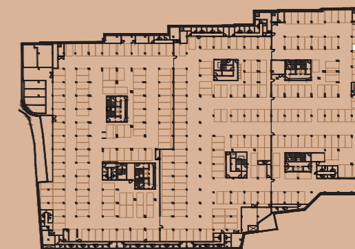
PLANTA PISO ESTACIONAMENTO -2 / PARKING FLOOR -2