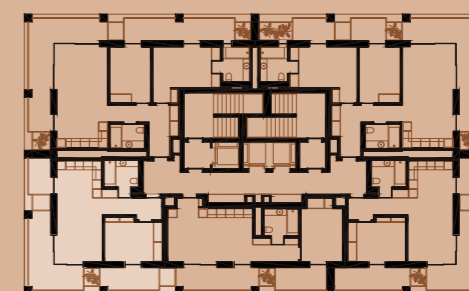
PLANTA PISO 19 | FLOOR PLAN 19

LUGARES DE ESTACIONAMENTO | PARKING UNITS 1