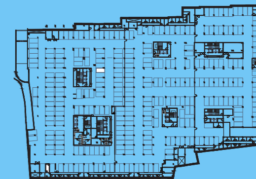
PLANTA PISO ESTACIONAMENTO -1 / PARKING FLOOR -1