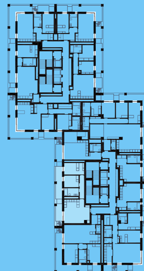
PLANTA PISO 11 | FLOOR PLAN 11

LUGARES DE ESTACIONAMENTO + ARRECAÇÃO | PARKING UNITS + STORAGE 2+1