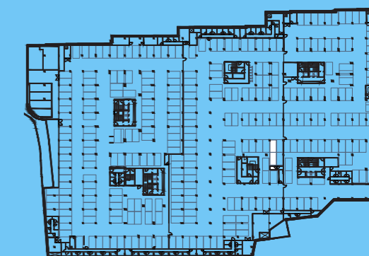
PLANTA PISO ESTACIONAMENTO -2 / PARKING FLOOR -2