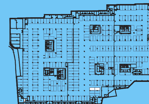
PLANTA PISO ESTACIONAMENTO -2 / PARKING FLOOR -2