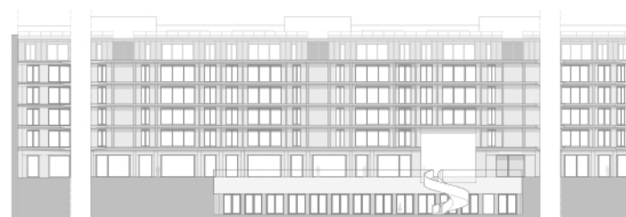
Alçado Sudoeste - Praça Interior