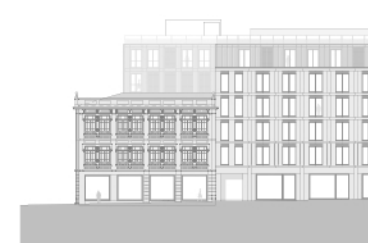
Alçado - Rua Formosa