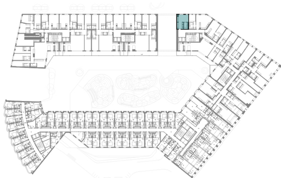
Piso 1 | Floor 1 | Étage 1

As áreas aqui apresentadas são aproximadas, indicativas e sem caráter contratual. The areas here contained are approximate, indicative and have no contractual nature. Les surfaces sont approximatives et les plans indicatifs, non contractuelles et données à titre informatif. Surfaces en conformité avec la législation portugaise