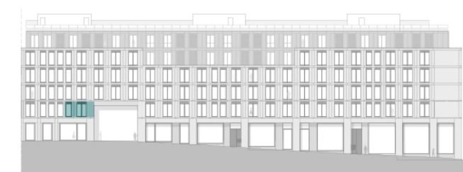
Alçado - Travessa do Bonjardim