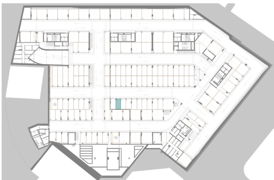
Piso -3 | Floor -3 | Étage -3 Estacionamento / Parking / Parking