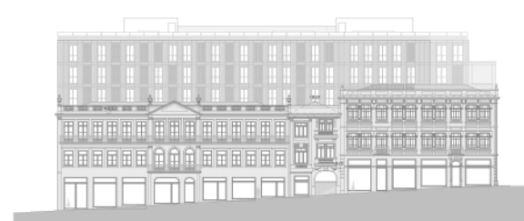
Alçado - Rua Sá da Bandeira