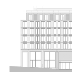
Alçado - Rua do Bonjardim