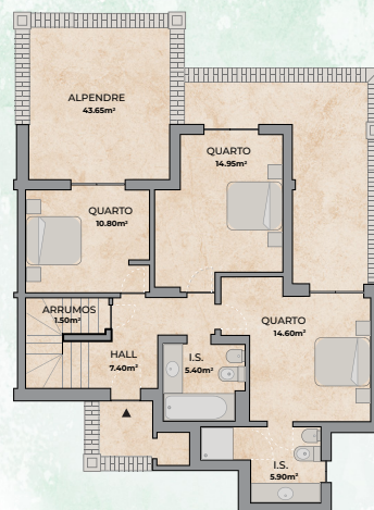
PISO DE ENTRADA