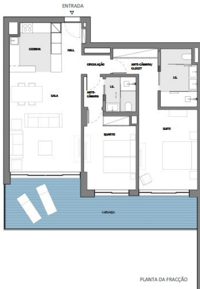
PLANTA DA FRACÇÃO