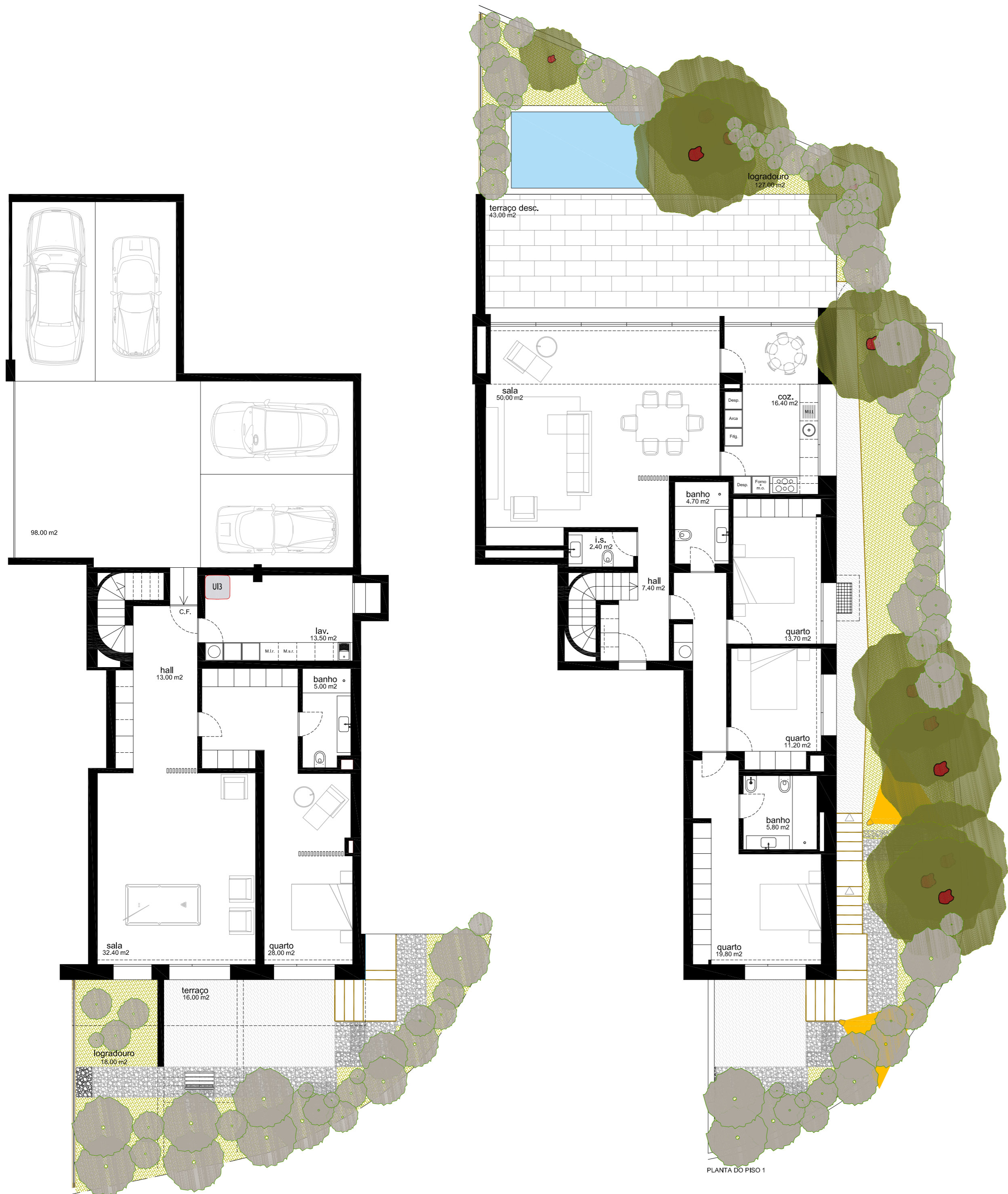
PLANTA DO PISO 1