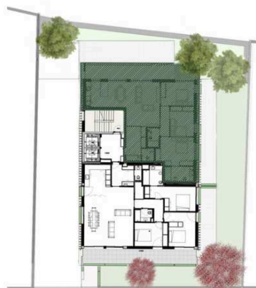
LOCALIZAÇÃO: PISO 3