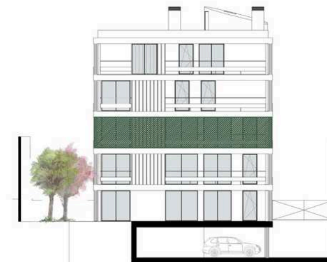
ALÇADO PRINCIPAL (SUDESTE)