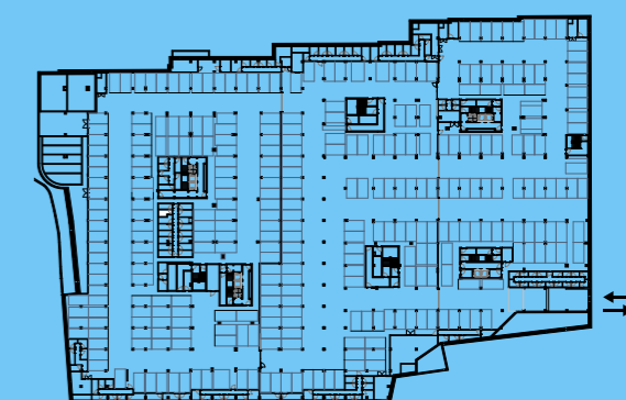
PLANTA PISO ESTACIONAMENTO -2 / PARKING FLOOR -2