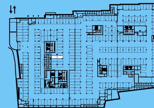
PLANTA PISO ESTACIONAMENTO -1 / PARKING FLOOR -1