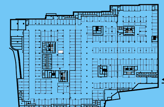
PLANTA PISO ESTACIONAMENTO -2 / PARKING FLOOR -2