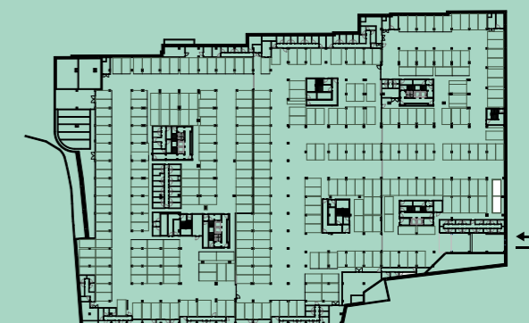
PLANTA PISO ESTACIONAMENTO -2 / PARKING FLOOR -2