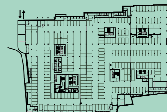
PLANTA PISO ESTACIONAMENTO -1 / PARKING FLOOR -1