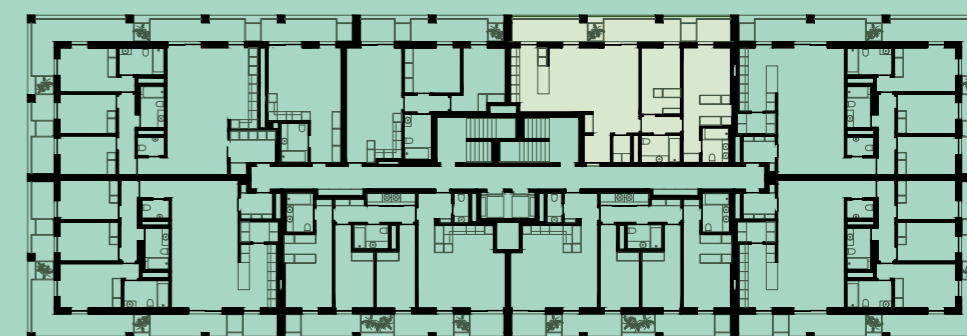
PLANTA PISO 5 | FLOOR PLAN 5

LUGARES DE ESTACIONAMENTO + ARRECAÇÃO | PARKING UNITS + STORAGE 2+1