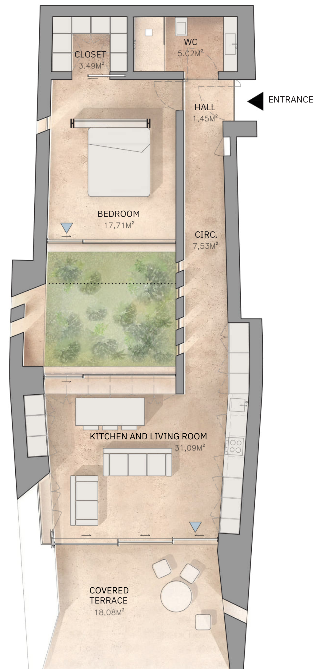
PLANTA DO RÉS DO CHÃO ENTRANCE FLOOR PLAN

FASE II (LOTE 118) | PHASE II (PLOT 118)