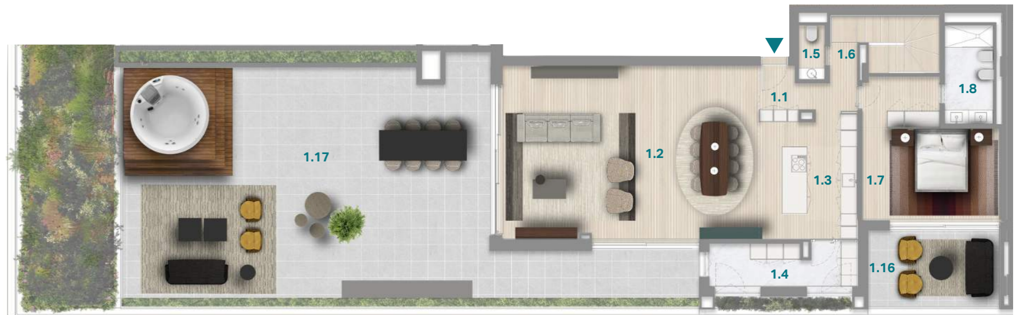
PISO 5 5 TH FLOOR