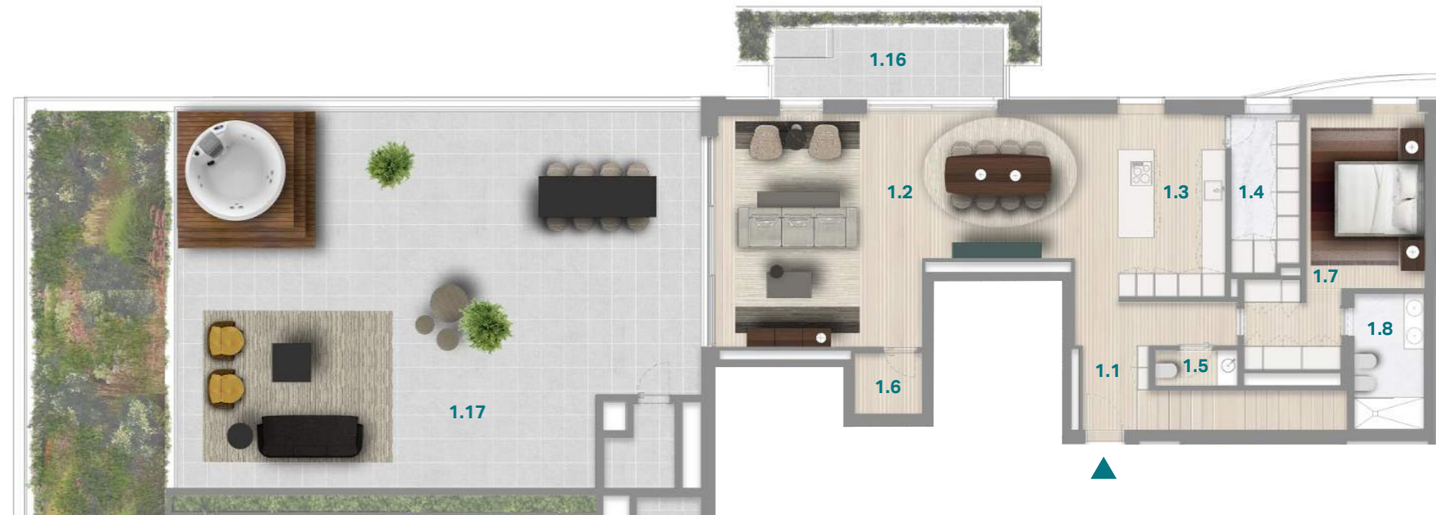
PISO 5 5 TH FLOOR