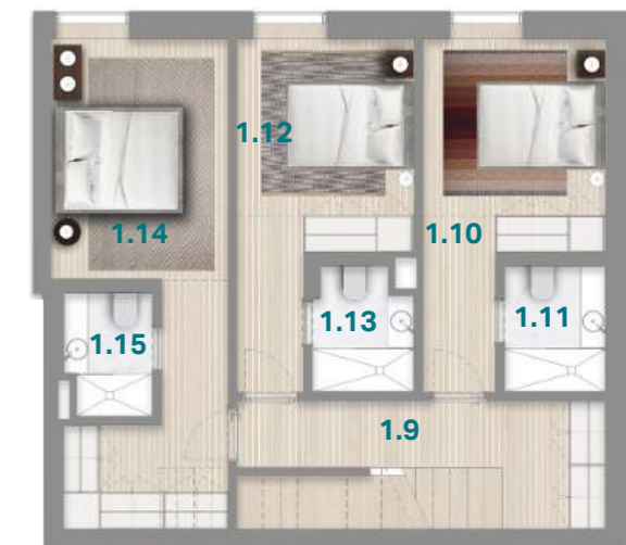
PISO 4 4 TH FLOOR

APARTAMENTO BP ENTRADA A APARTMENT ENTRANCE