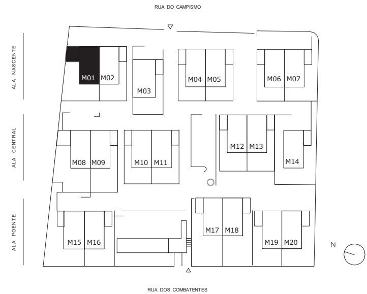
Planta geral General plan