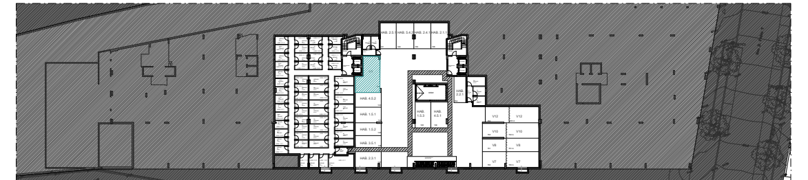
PISO -1 | ÉTAGE -1 | FLOOR -1