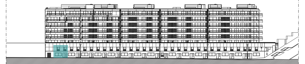
ALÇADO SUL - RUA CAPITÃO SALGUEIRO MAIA