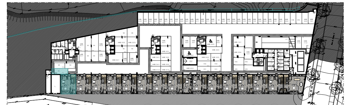
PISO 0 | ÉTAGE 0 | FLOOR 0