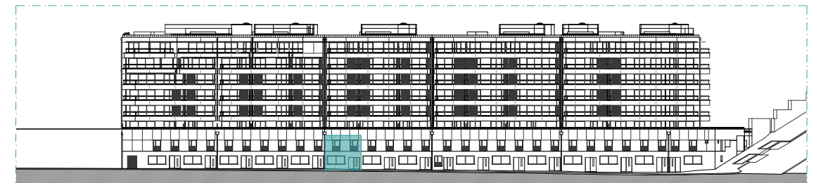
ALÇADO SUL - RUA CAPITÃO SALGUEIRO MAIA