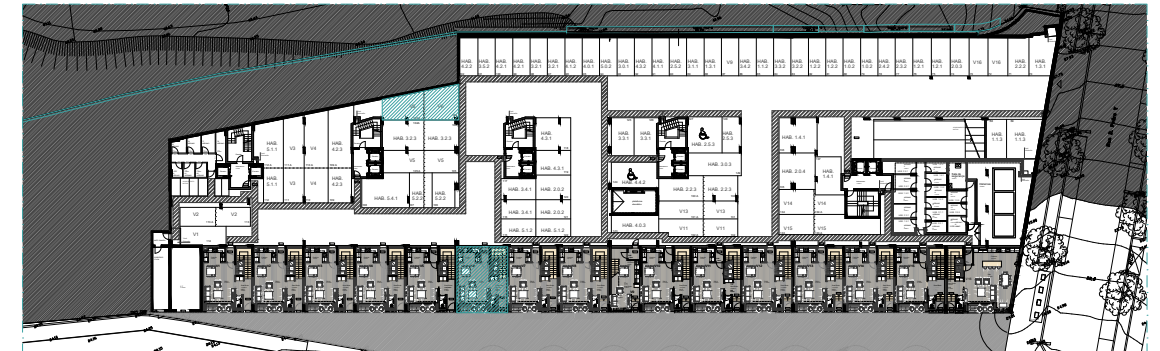
PISO 0 | ÉTAGE 0 | FLOOR 0