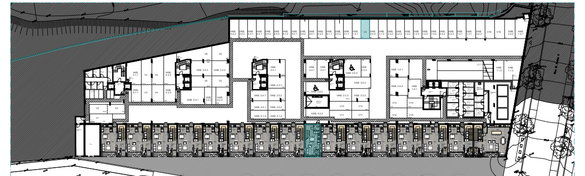
PISO 0 | ÉTAGE 0 | FLOOR 0