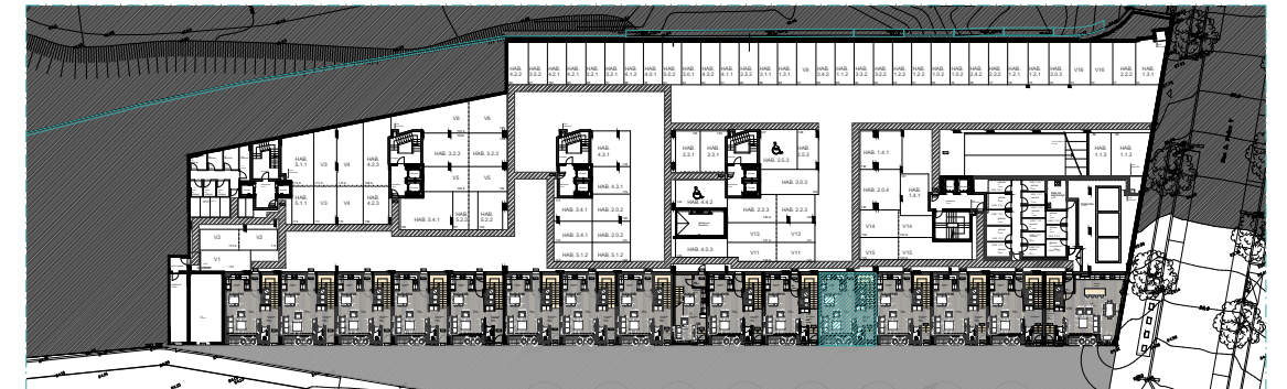
PISO 0 | ÉTAGE 0 | FLOOR 0