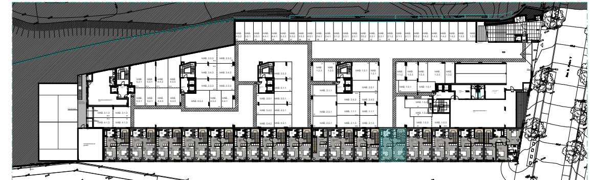
1° PISO | ÉTAGE 1 | 1ST FLOOR