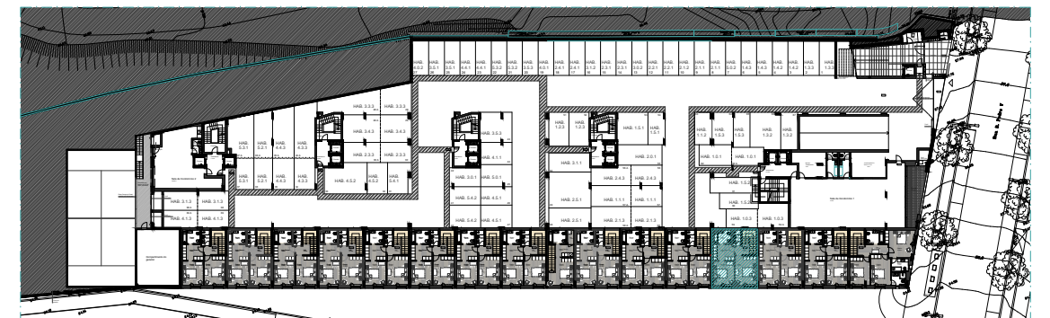
1º PISO | ÉTAGE 1 | 1ST FLOOR