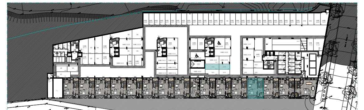
PISO 0 | ÉTAGE 0 | FLOOR 0