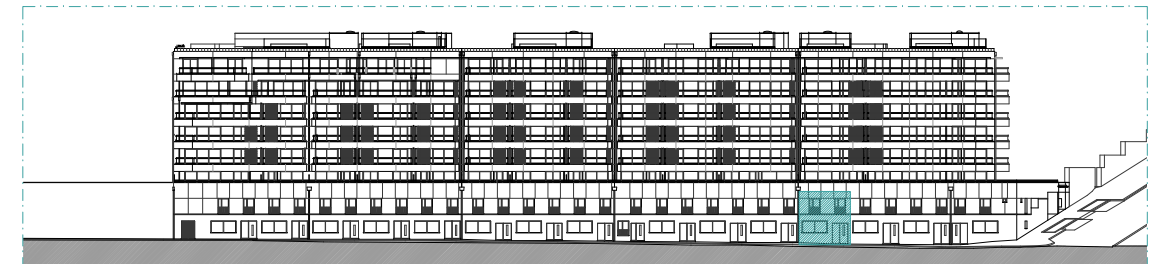
ALÇADO SUL - RUA CAPITÃO SALGUEIRO MAIA