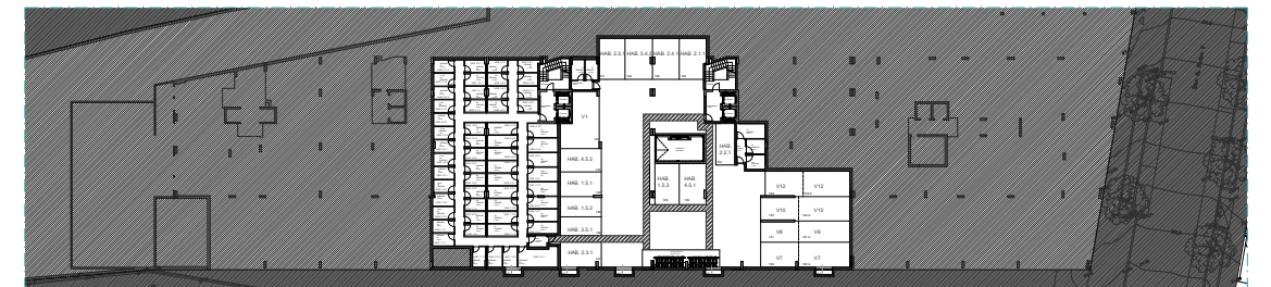
PISO -1 | ÉTAGE -1 | FLOOR -1