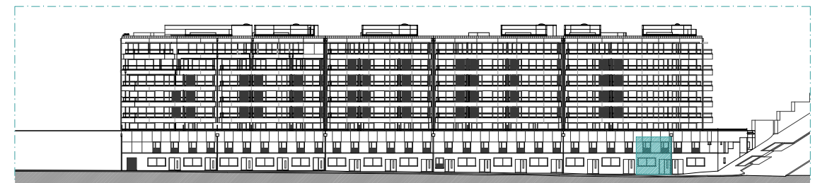
ALÇADO SUL - RUA CAPITÃO SALGUEIRO MAIA