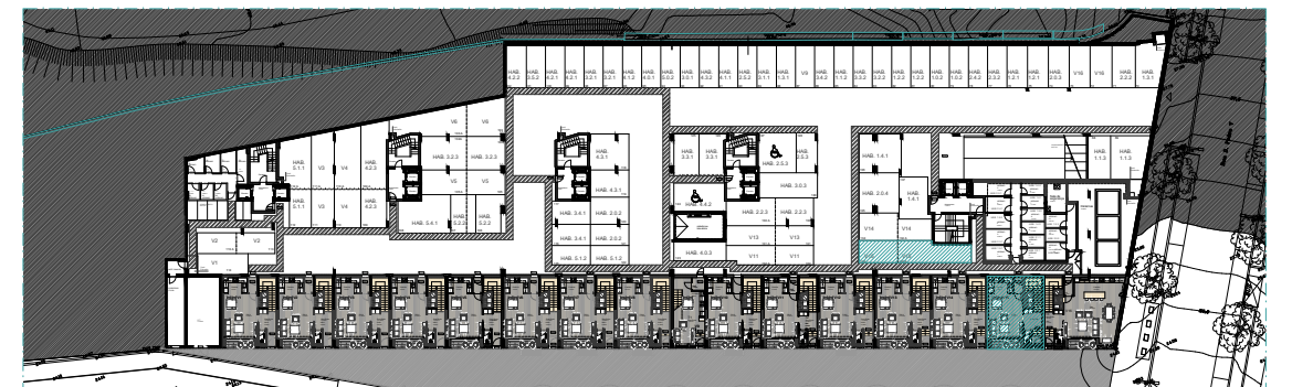
PISO 0 | ÉTAGE 0 | FLOOR 0