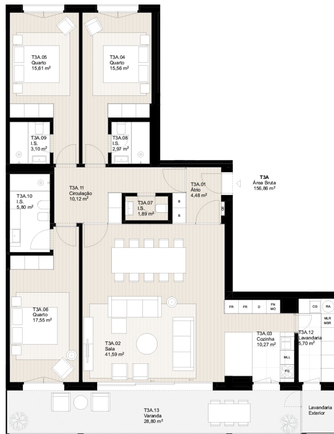
PLANTA DO PISO 2