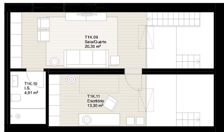
PLANTA DO PISO 2