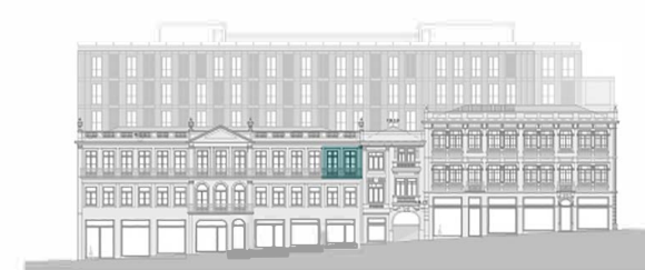
Alçado - Rua Sá da Bandeira