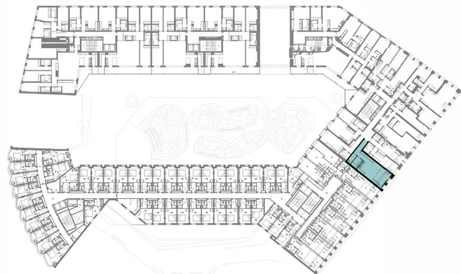
Piso 1 | Étage 1 | Floor 1

As áreas aqui apresentadas são aproximadas, indicativas e sem caráter contratual. The areas here contained are approximate, indicative and have no contractual nature. Les surfaces sont approximatives et les plans indicatifs, non contractuelles et données à titre informatif. Surfaces en conformité avec la législation portugaise