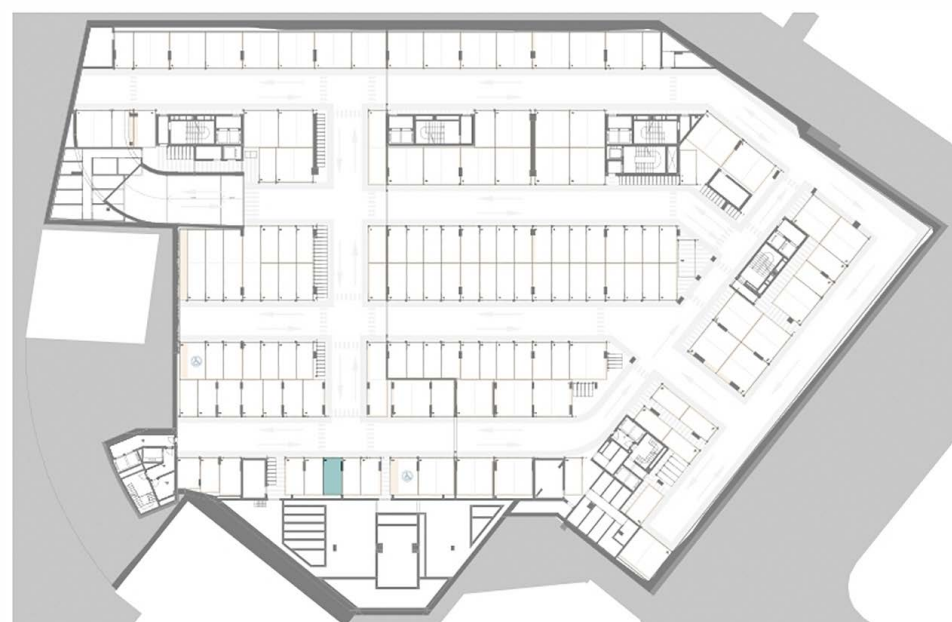
Piso -3 | Étage -3 | Floor -3 Estacionamento / Parking / Parking