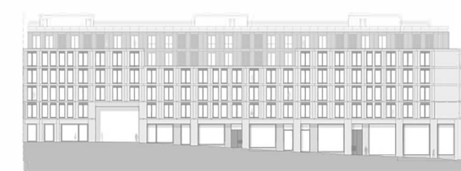
Alçado - Travessa do Bonjardim