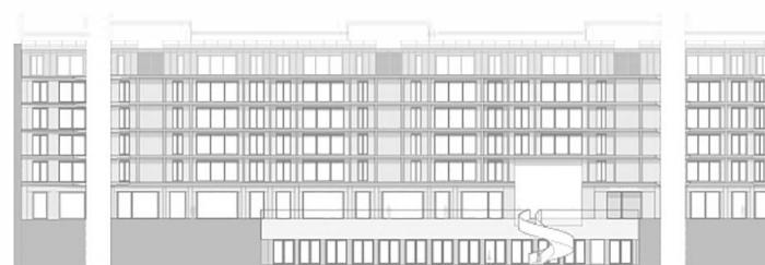
Alçado Sudoeste - Praça Interior