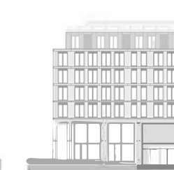
Alçado - Rua do Bonjardim