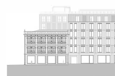
Alçado - Rua Formosa