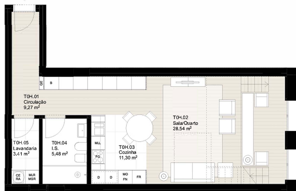
PLANTA DO PISO 1