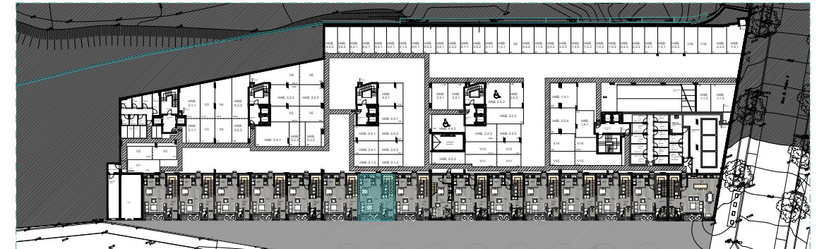
PISO 0 | ÉTAGE 0 | FLOOR 0